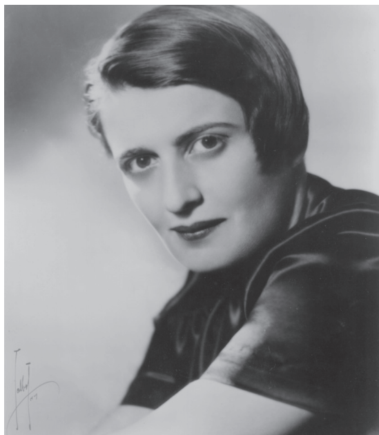
Ayn Rand 1943

kan nok ikke overvurderes. Hun kan således have oplevet en pludselig klarhed og dermed lagt kimen til sin filosofi allerede på dette tidspunkt (transit Uranus i konjunktion med og transit Saturn i opposition til hendes Saturn).