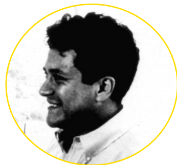
Carlos Castaneda 25. december 1925, kl. 9:00 Cajamar, Peru kilde: Astro.com, AA-data

Vender man imidlertid opmærksomheden mod mere usædvanlige aspekter finder man, at Solen danner en halvkvintil til Mars og en novil til Saturn. Kvintiler indikerer blandt meget andet en sjælden indsigt, som kan stamme fra dybere indre ressourcer, en følelse af at vide. Det kan være evnen til at have det store overblik og samtidig fokusere skarpt. Tallet "ni" (novilen er en ni-delning) forbindes med indvielse, visdom og spirituel lærdom, og novilen kan bringe et menneske i kontakt med dets indre drivkraft og skabe en følelse af at blive genfødt som et mere helt og perfekt individ.